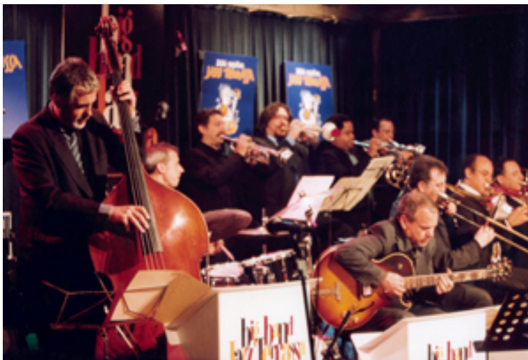
La Big Band Jazz Terrassa ha protagonitzat alguns dels concerts de més èxit de la temporada estable de la Nova Jazz Cava.

En total, durant 2009, s'han realitzat 83 concerts a la Nova Jazz Cava de Terrassa, que han reunit 6.100 espectadors, una audiència mitjana de 70 persones per sessió (aquestes xifres no inclouen el públic de les jam-sessions gratuïtes dels dimarts, que no es comptabilitzen). Aquestes xifres suposen un lleuger augment de la mitjana d'espectadors per concert respecte a 2008 i fan pensar que l'estratègia adoptada ha estat encertada. Tot i així, cal assenyalar que les oscil·lacions d'assistència entre uns concerts i altres són molt acusades, tant en la temporada estable com en el Festival, i sempre difícils de predir i governar.